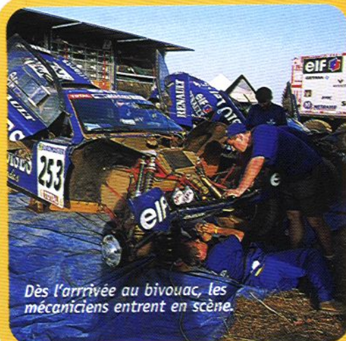
Dès l'arrivée au bivouac, les mécaniciens entrent en scène.