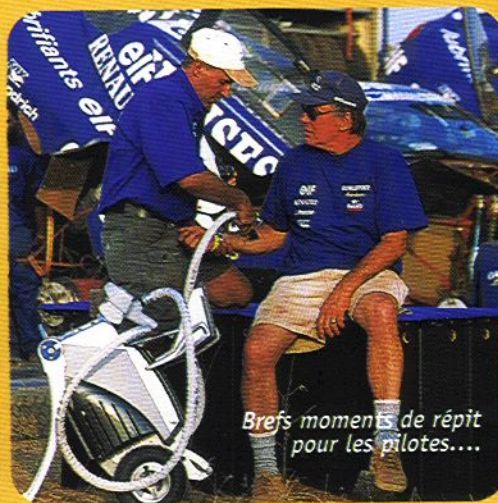
Brefs moments de répit pour les pilotes....